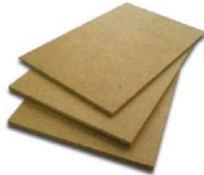
WOOD PLATFORM WITHOUT CARPET