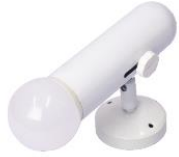
Spotlight 9W. standard (LED)