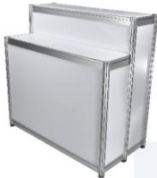
2 - Tier Counter 50X100X100 / 120 cm.