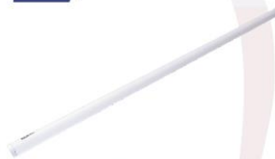
Fluorescent Light 1.2 m. 14W. (LED)