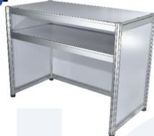
Counter 50X100X75 / 100 cm.