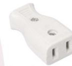
Socket for connecting by exhibitors per unit of 100W.