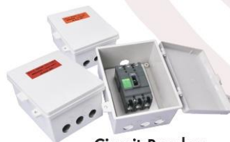
Circuit Breaker Three Phase 380V. 50Hz.