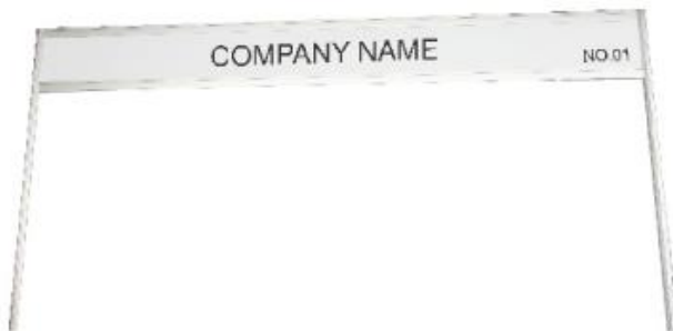
FASCIA BOARD WITH STANDARD LETTERING 10CM. HIGH 100x30 CM