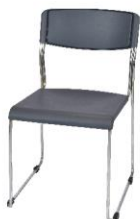
Fiber Chair 50X50X50 / 80 cm.