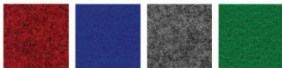
NEEDLE PUNCH CARPET RED/BLUE/GREY/GREEN