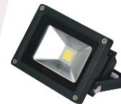
Floodlight LED 30W. 220V. Warm Light (LED)