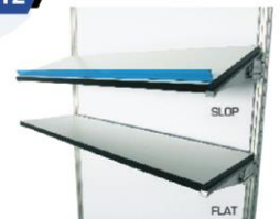
Wall Shelf 25X100 cm.