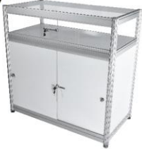
Counter Showcase 50X100X100 cm.