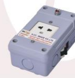
Socket 5 Amp (5 Amp fuse) 220V. 50Hz. (Not For lighting)