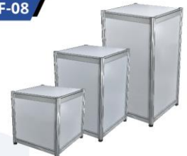
Display Stand 50X50X50 / 75 / 100 cm.