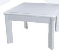
Coffee Table 65X65X40 cm.