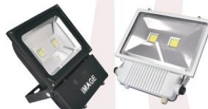
Floodlight 100W. 220V. Day Light (LED)