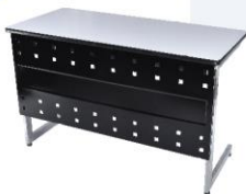
Receptionist Desk 55X120X75 cm.