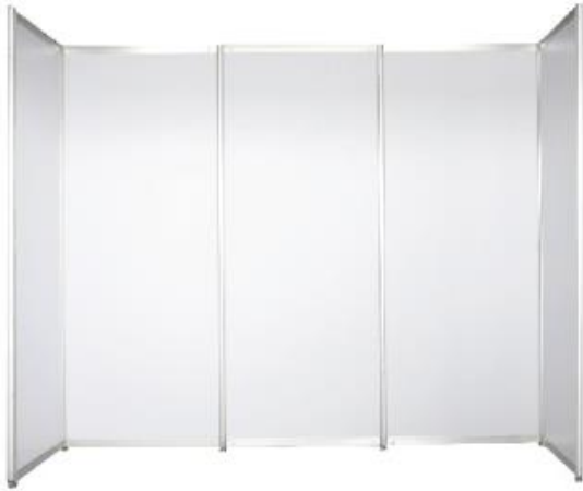
PANEL 100x250 CM (SYSTEM BUILT)