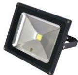
Floodlight LED 50W. 220V. Warm Light (LED)