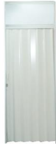
FOLDING DOOR 100x200 CM (SYSTEM BUILT)