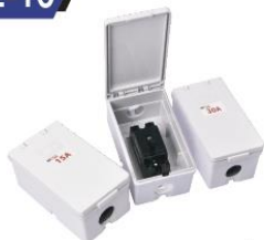
Circuit Breaker Single Phase 220V. 50Hz.