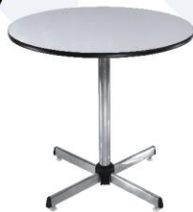
Round Table 75X75X75 cm.