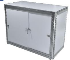
Lockable Cabinet 50X100X75 cm.