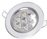
Down Light 7W. (LED)